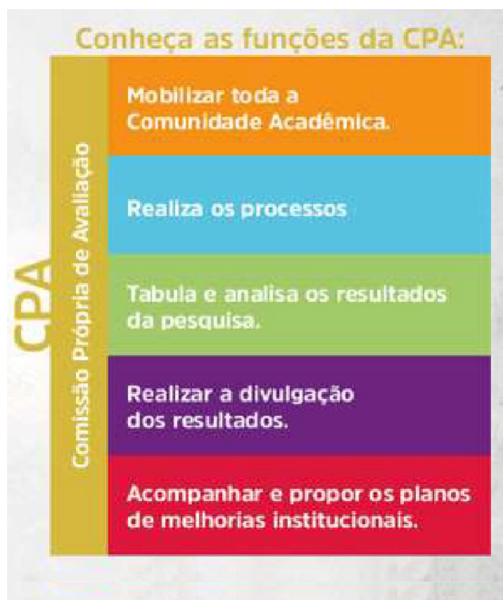
FIGURA 1- FUNÇÕES DA CPA