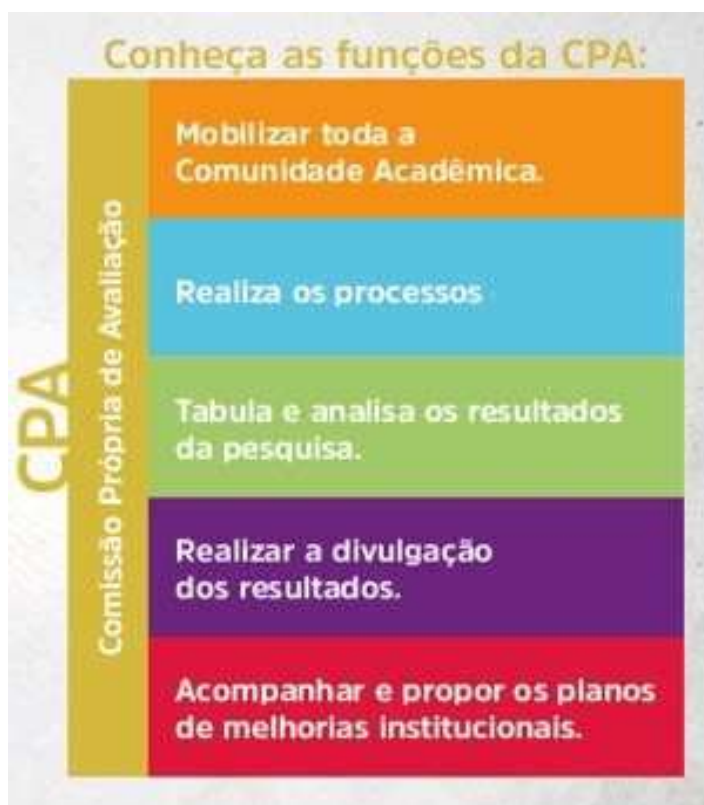
Figura 3 – Funções CPA